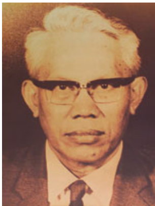
Mr. Sjafruddin Prawiranegara Masa Jabatan : 1951 - 1953