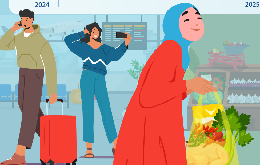
Tingkat Inflasi month to month (mtm)